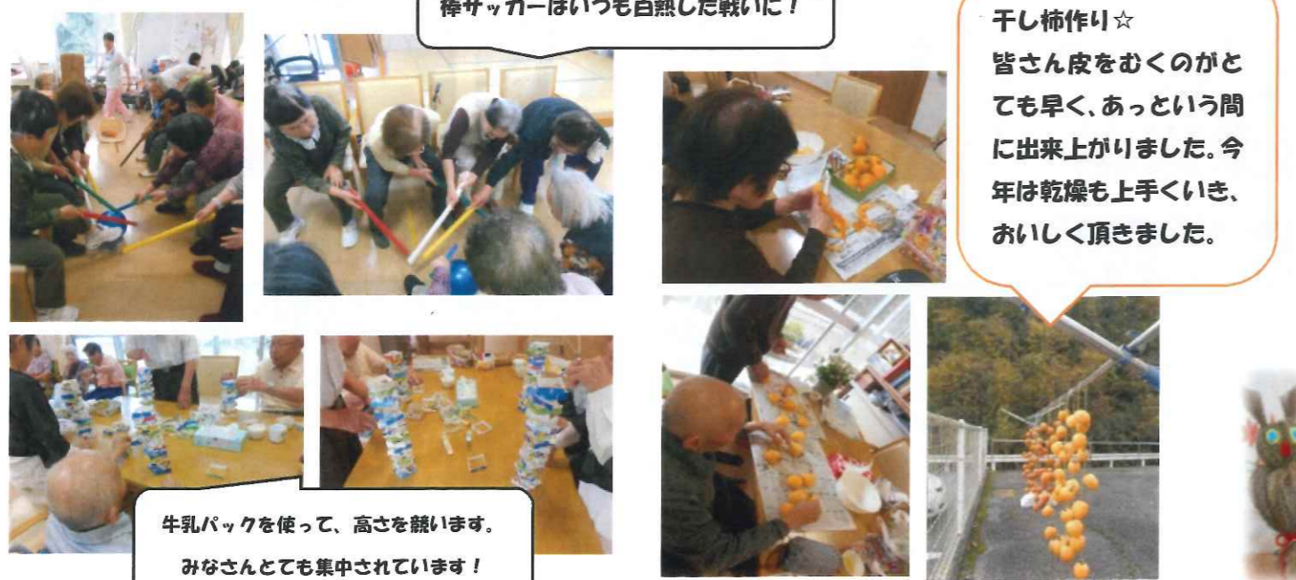
棒サッカーはいつも白熱した戦いに！