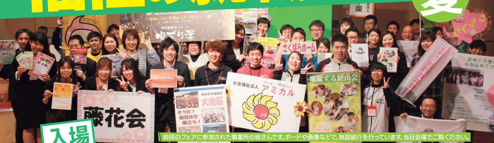
前回のフェアに参加された事業所の皆さんです。ボードや画像などで、施設紹介を行っています。当日会場をご覧ください。